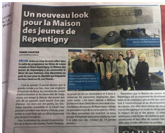
Lancement du local BackStage 50 de la Maison des Jeunes de Repentigny