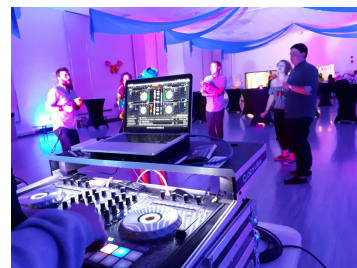
25ème anniversaire de RAP-Jeunesse des Laurentides

Nous aurions souhaité être plus actifs avec notre service d'animation au cours de l'exercice complété. Nous aurons tout de même animé le 25ème anniversaire de RAP-Jeunesse des Laurentides à Charlesbourg et conclu un contrat pour un mariage qui se déroulera en juin 2019 à Repentigny.